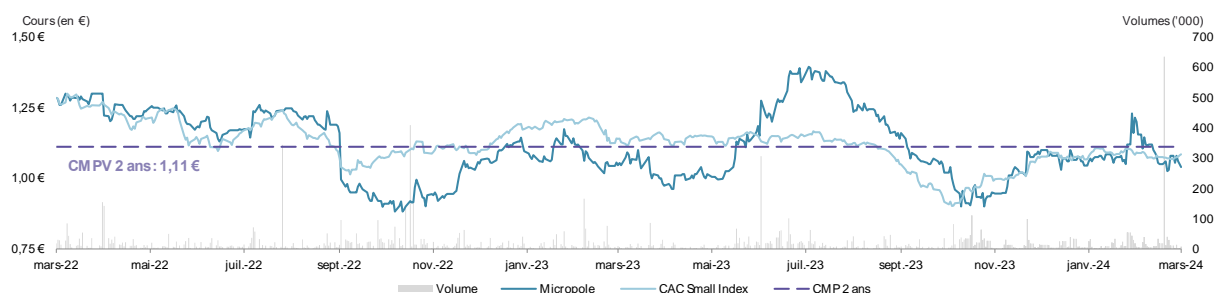
Figure 5 – Cours et volumes de l'Action de la Société depuis 2 ans (arrêté au 22 mars 2024)

L'analyse du cours de bourse a été arrêtée en date du 22 mars 2024, dernier jour de négociation précédant l'annonce du projet d'Offre Initiale.